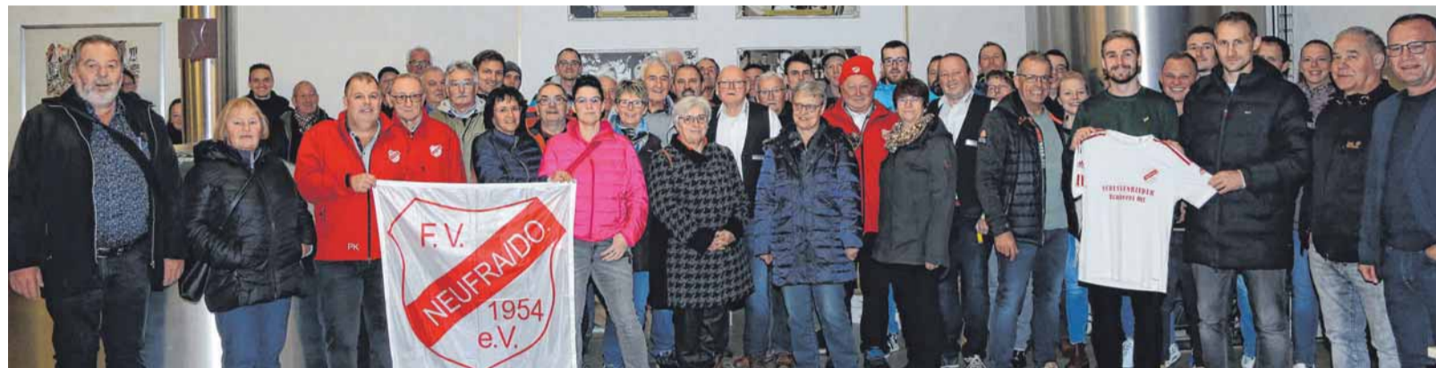
Gruppenbild mit den FVN-Vereinsmitgliedern sowie den Brauern und dem Außendienstmitarbeiter der Schussenrieder Brauerei

Nach dem Essen dankte der FVN-Vorstand bei seiner Rede allen